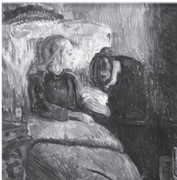
Edward Munch - Chore dziecko

Bez ustanku pluję krwią. Och, przeraziłabym pana, gdyby mnie pan zobaczył. Jest pan szczęśliwy, że może przebywać