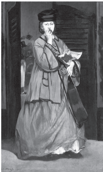
Eduard Manet - Uliczna śpiewaczka

W mojej chorobie przed ostatnim stadium następuje zazwyczaj polepszenie. Trwa ono parę tygodni. Ten czas lekarze wyzyskują na to, aby wysłać takiego pacjenta gdziekolwiek bądź, do domu lub na wieś, prywatnie, aby nie umarł w sanatorium. Moja poprawa zaczyna już mijać. Ja cię bardzo przepraszam, mój drogi, ale ja na to nic nie mogę poradzić. Obciąłbym – uśmiechnął się – ale nie mogę... I dlatego nie bardzo